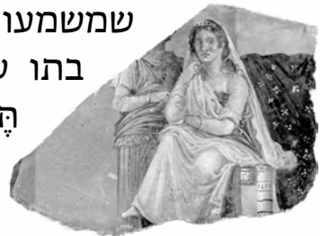
פדרה, פרסקו ממומפי, 20-60 לפנה"ס Phaedra, a fresco from Pompeii, 60-20 BC

פדרה היא דמות מהמיתולוגיה היוונית. שמה נגזר מהמלה היוונית φαίδρος (פאידרוס), שמשמעותה בהיר. פדרה הייתה בתו של מינוס, רעייתו של תֵּזֶאוּס ואמם של דֵּמוֹפּוֹן מאתונה ושל אֶקֶמֶ-אס. פדרה מתאהבת